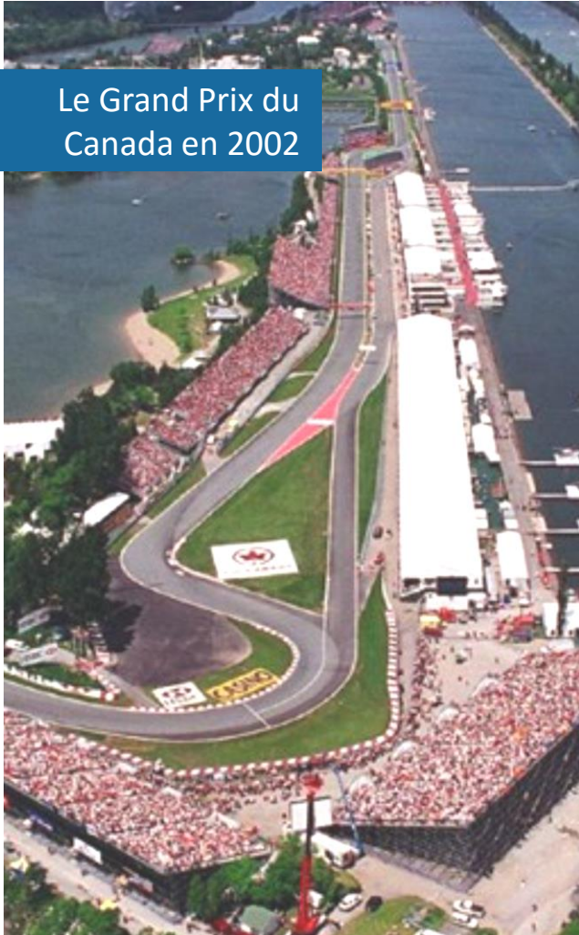
Le Grand Prix du Canada en 2002