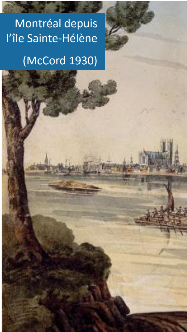
Montréal depuis l'île Sainte-Hélène (McCord 1930)