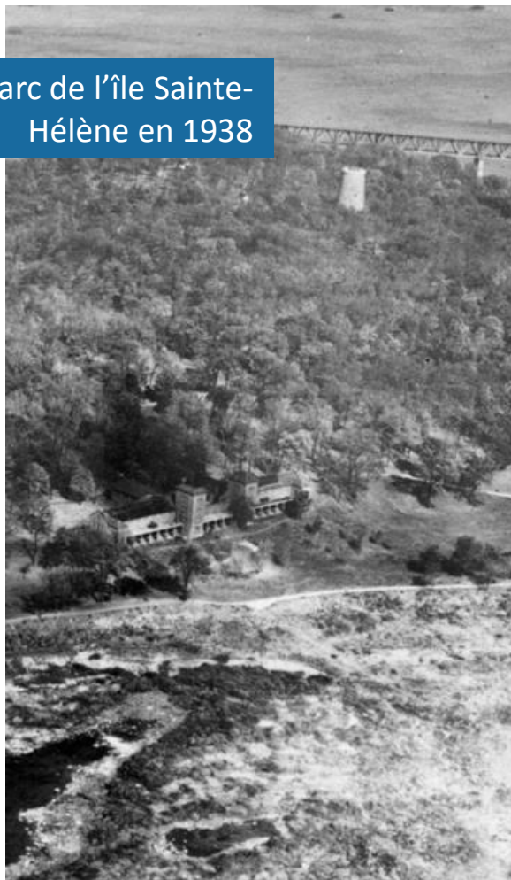
Parc de l'île Sainte-Hélène en 1938